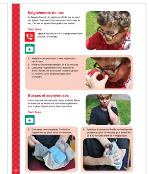
Exemples de pages